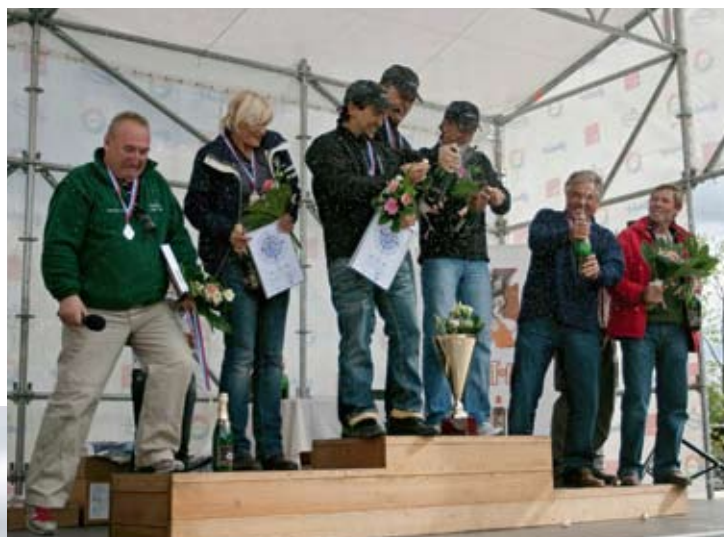
Церемония награждения призеров и победителей соревнований в национальном классе «ЭМ-Ка»